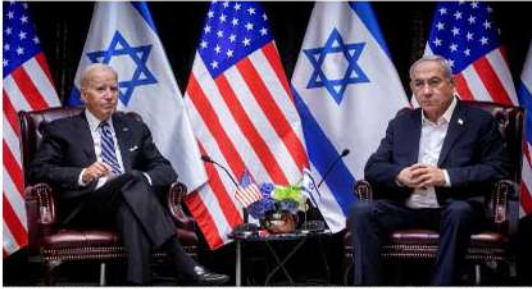
El presidente de EE.UU., Joe Biden, y el primer ministro israelí, Benjamin Netanyahu, el miércoles en Tel Aviv.