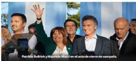
Patricia Bullrich y Mauricio Macri en el acto de cierre de campaña.